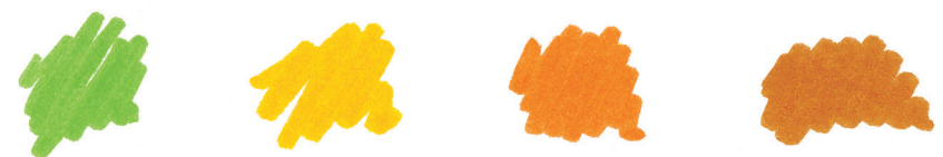
Gama de color del Otoño