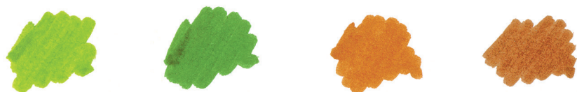
Gama de color del Verano